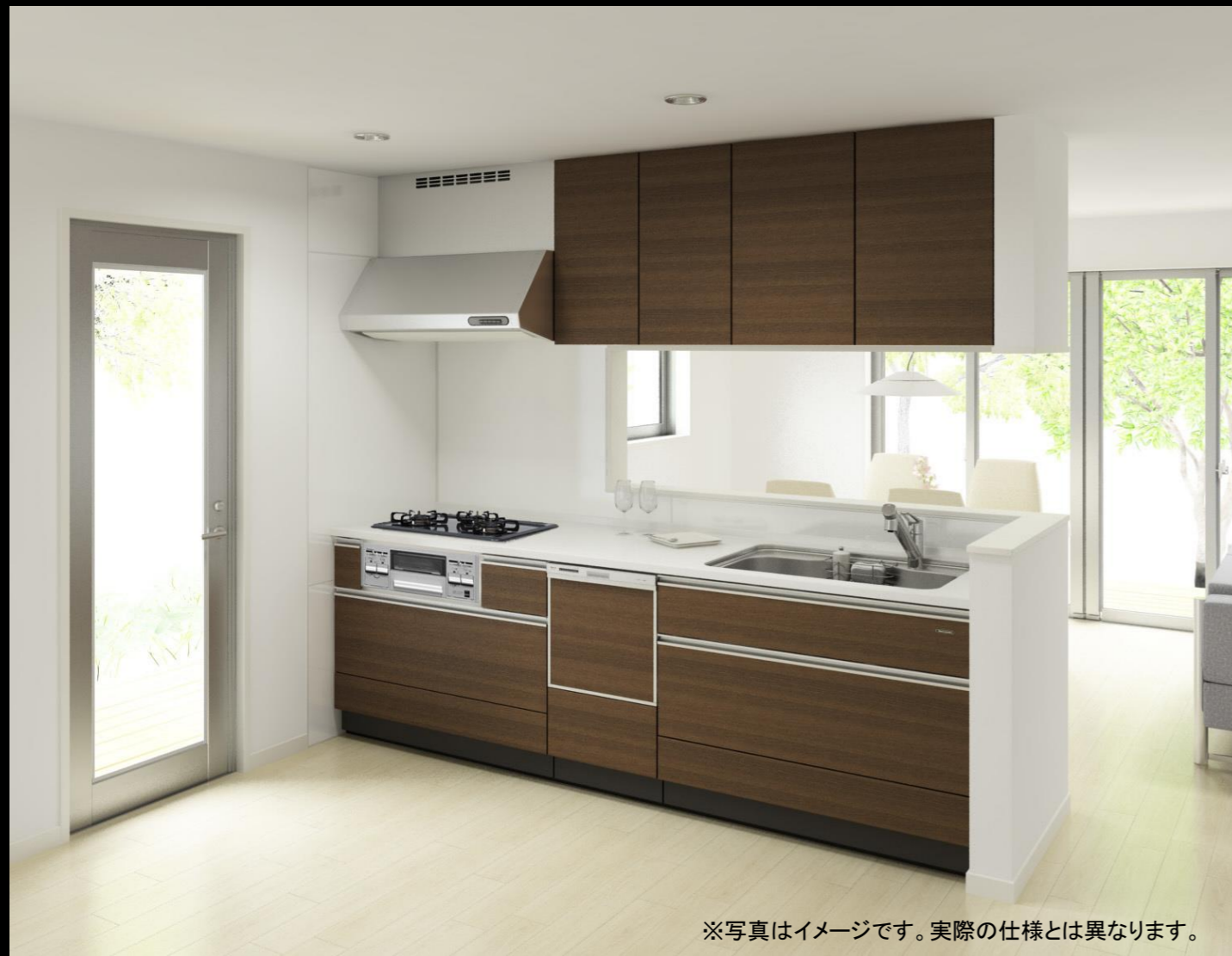
※写真はイメージです。実際の仕様とは異なります。