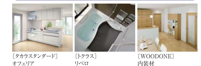
〔タカラスタンダード〕オフエアリア 〔トクラス〕リベロ 〔WOODONE〕内装材